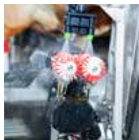
Rene børster til forbehandling